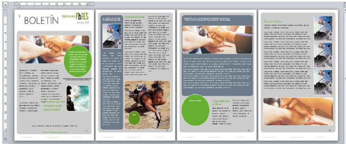
Vista de la plantilla de Boletín Digital